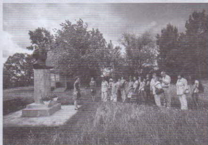
Бюст поэта Васи́лия Дми́триевича Фёдорова (д. Марьевка)

При подготовке этого тура значительный вклад внесли районная и поселковая администрация, без их заинтересованности вряд ли реализация этого проекта была бы возможна. Проведены работы по очистке и благоустройству