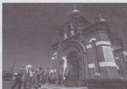
Храм Преподобномученика Андрея Критского

В ходе экскурсий мы знакомим экскурсантов с местными ремеслами, вовлекаем