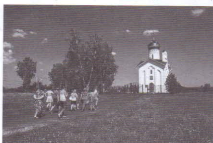
Часовня Сошествия Духа Святого (г. Тайга)