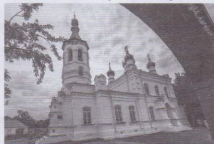
Храм Петра и Павла (г. Салаир)