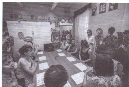
Мастер-класс «Изделия из кедра своими руками»

праздников (фестиваль «Золотая осень в Кузбассе», литературный праздник «Фёдоровские чтения»),