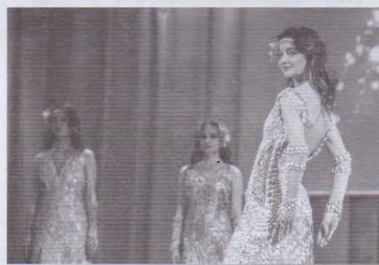
Образцовый коллектив студии Любавушка (г. Тайга)

женниках Транссиба и основателе города, писателе Николае Георгиевиче Гарине-Михайловском. В программу экскурсионной поездки входит пешая экскурсия по историческим местам города: памятники зодчества архитектора Константина Лыгина, храм преподобномученка Андрея Критского, здание железнодорожного вокзала, лавка купца Магазова.