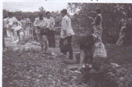
Родник Любви (Марьевка)

Воссоздание литературной значимости малых и небольших сельских территорий за счёт объединения потенциала культуры, туризма и сферы услуг может стать реальным и эффективным