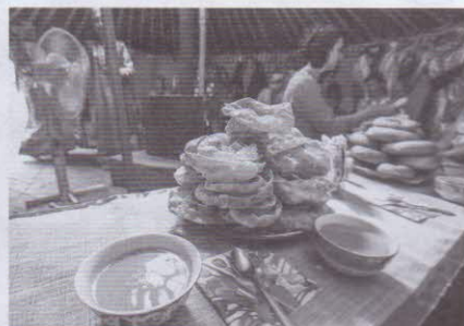
Национальная кухня народа Телеуты

Программа развития регионального литературного туризма ориентирована на долгосрочную перспективу. Эта услуга: