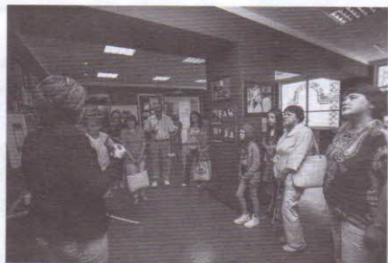
Экскурсия в Литературно-мемориальный музей поэта В. Д. Фёдорова

В 2016 г. был разработан и удачно осуществляется литературно-туристический маршрут «В Марьевку, на встречу с Василием Фёдоровым». Однодневный экскурсионный маршрут по Яйскому району Кемеровской области знако-