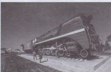
Паровоз П36-0192 (г. Тайга)

территорий и родников, замеры химического состава воды, оборудованы пло-