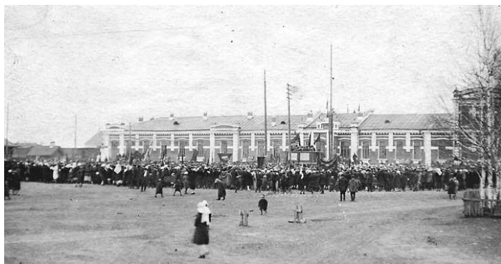
На снимке: открытие железнодорожного вокзала станции Топки. 1916 год.

95 лет назад (1914 г.) началось строительство станции Топки и основано село Топки в связи со строительством в начале 1913 года железнодорожной ветки от Юрги до Кольчугино и Кемерово. Все работы выполнялись вручную. В строительстве принимали участие и крестьяне из близлежащих сел, и ссыльные, и переселенцы. На перепутье дорог нужна была узловая станция - там и столкнули, на 104 версте, с рельсов вагончик. И в октябре 1914 года, а это через год и 10 месяцев был заложен фундамент паровозного депо. В том же году построена водонапорная башня, на территории паровозного депо. Через год открылось временное грузовое движение из Юрги до Кемерово. Составы со скоростью 10-12 километров в час «мчались» мимо полей и болот, останавливаясь у железнодорожного вагона с вывеской «Станция Топки».