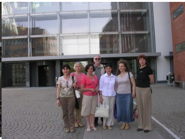
Библиотека университетского колледжа г. Бороса (Швеция)

За счет средств Европейского Союза для эффективного управления технологическими процессами была приобретена многофункциональная интегрированная АБИС VIRTUA американской корпорации VTLS, отвечающая международным стандартам. Автоматизированы процессы комплектования, освоены технологии штрих-кодирования, создан интерактивный электронный каталог нового поколения; с 2002 года библиотека первой в Кузбассе внедрила электронную выдачу изданий.