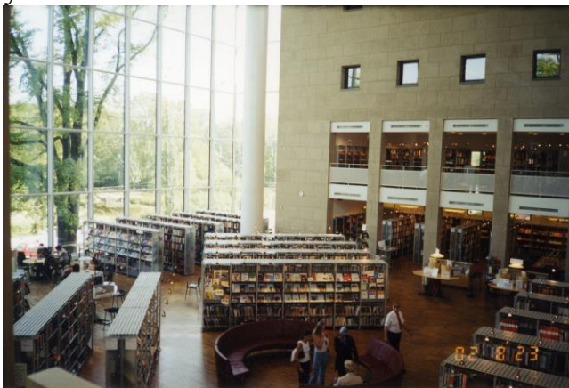
Публичная библиотека Мальмё (Швеция)

Международные конференции по обмену опытом, семинары, мастер-классы, круглые столы, обучающие визиты в библиотеки Великобритании и Швеции (гг. Лондон, Шеффилд, Честерфилд, Донкастер, Эксетер, Бат, Лунд, Мальме, Борос, Гетеборг, Оруст) способствовали изучению опыта работы европейских библиотек, обучению персонала НТБ работе в условиях новых технологий.