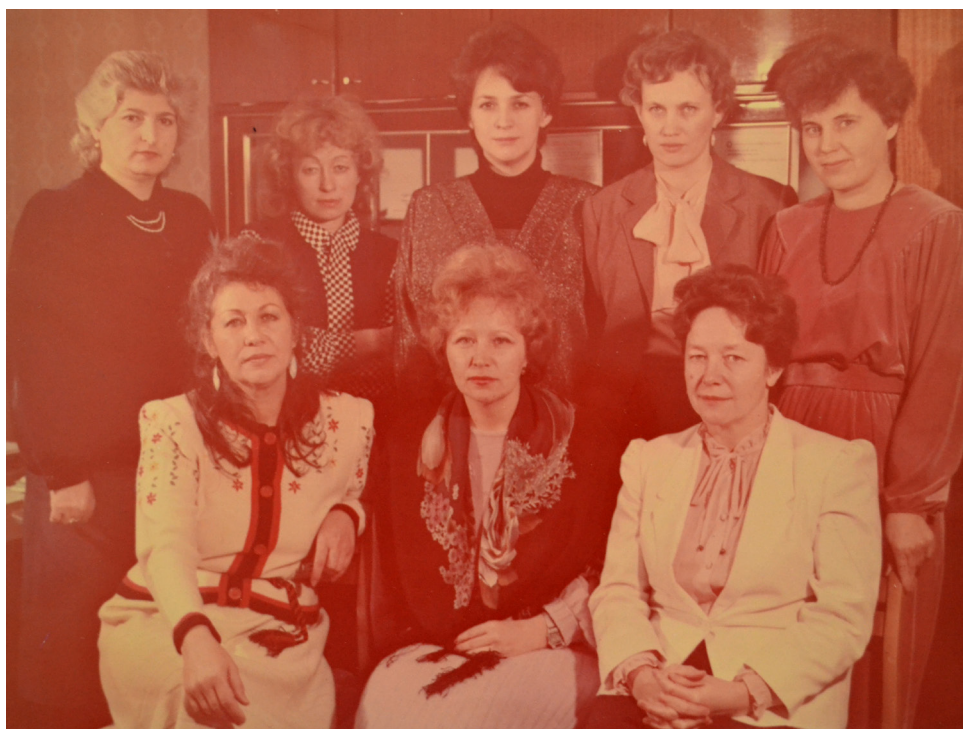
Преподаватели кафедры библиографии

Можно еще писать о многом, рассмотреть состояние образования, назвать и раскрыть новые предметы, обозначить наши перспективы. Это содержание других статей и работ других авторов. Мы же надеемся, что вместе вспомнили, как это было, когда мы были молоды, и так много было времени еще впереди.