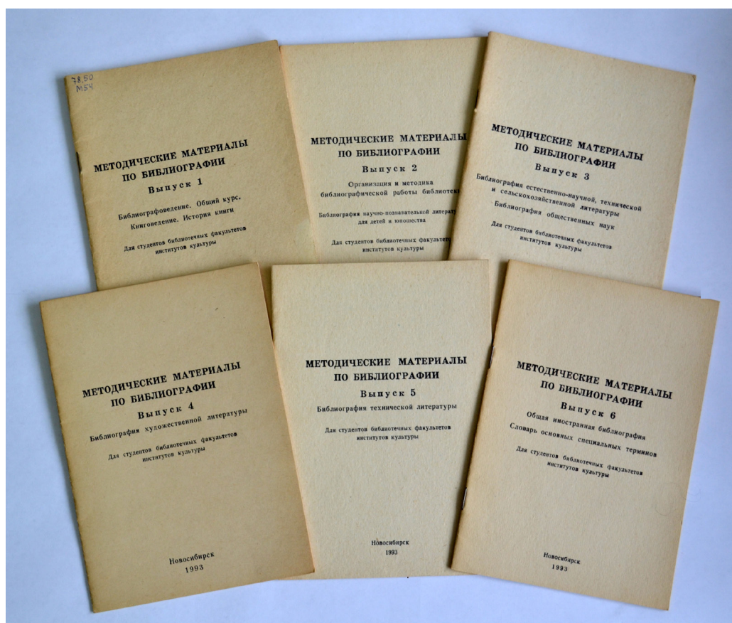
Комплект методических пособий кафедры библиографии